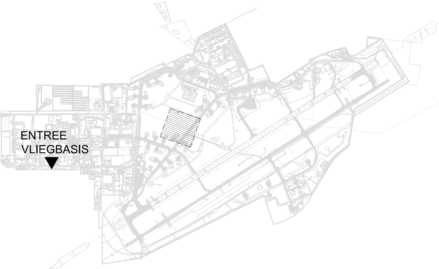
OVERZICHT PROJECTGEBIED OP DE VliegBASIS VOLKEL